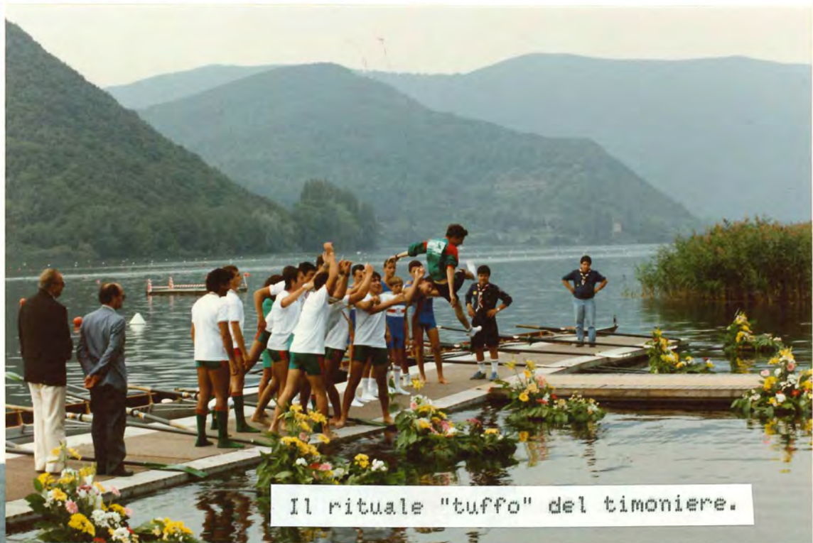
Il rituale "tuffo" del timoniere.