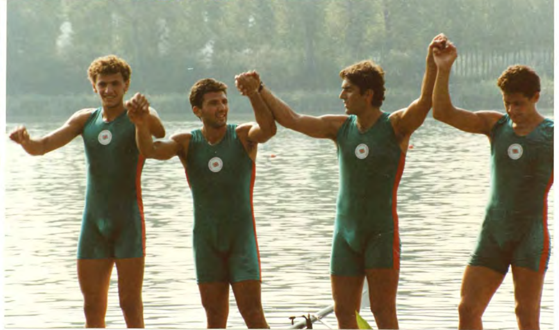
Premiazione del 4 senza Posillipino